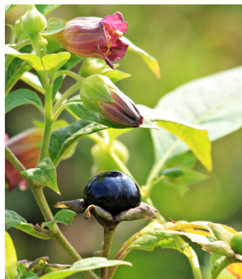
Fleur et baie de Belladone noire

Pour en savoir plus consulter notre article : ici